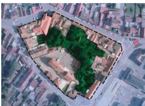
Réaliser un espace partagé entre générations sur l'îlot Jules Ferry,