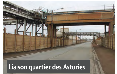
Liaison quartier des Asturies