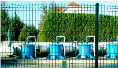
Station de pompage de l'Église