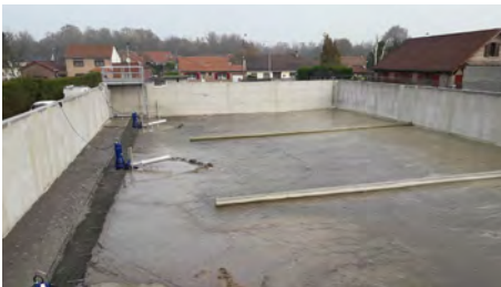
Rénovation de la station rue Denis Cordonnier