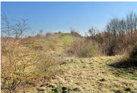
Le terriil : un site naturel à protéger

Scannez pour nous retrouver sur Facebook