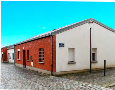
Des logements adaptés, rue Paul Bert