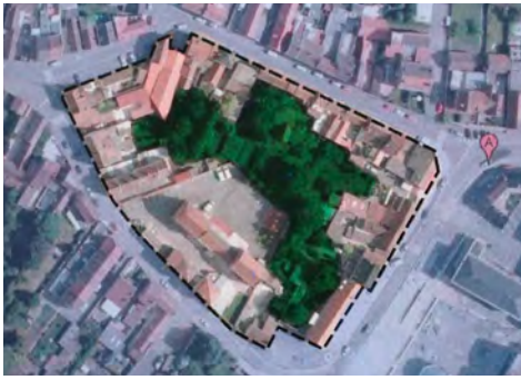
Réaliser un espace partagé entre générations sur l'îlot Jules Ferry,