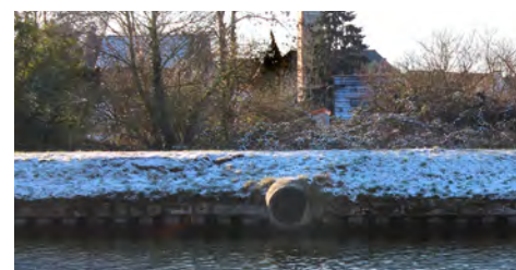
Sortie de la station de l'Église (visible au fond en contrebas)