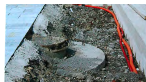
Réservoir de retenue Place de la République