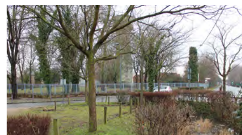
Rénovation rue de la rue Commune de Paris