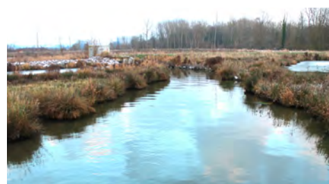
Bassin de stockage Hénin-Carvin