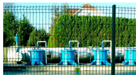
Station de pompage de l'Église