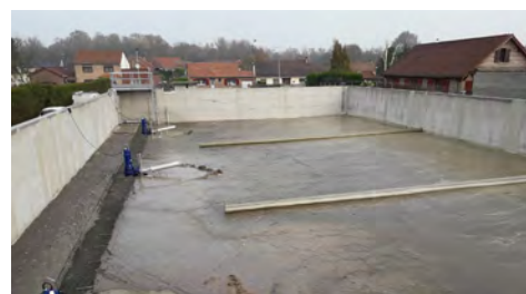
Rénovation de la station rue Denis Cordonnier