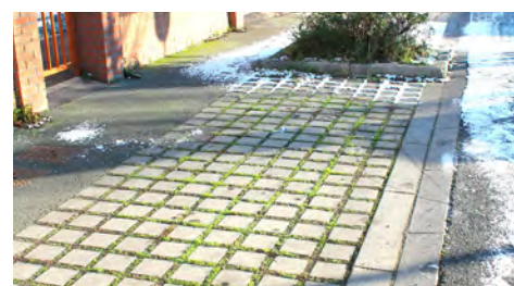
Parkings permettant l'infiltration des eaux de pluie